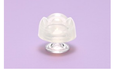
【LILY】 角度の違う凸凹でつくような刺激