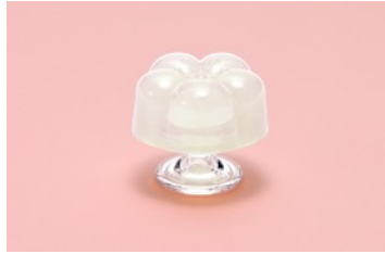
【PLUM】 ぷっくりした膨らみと細かな粒の多彩な刺激