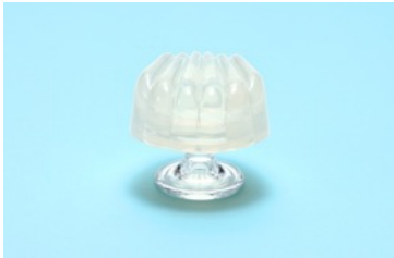
【SHELL】 繊細なプリーツのくすぐる刺激