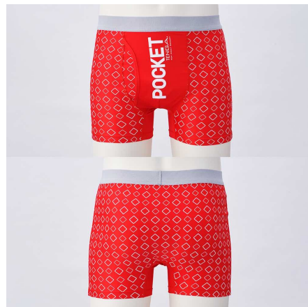
「POCKET TENGA パンツ」 ・素材：ポリエステル、ポリウレタン