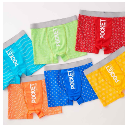
POCKET TENGA6種に合わせたカラー展開