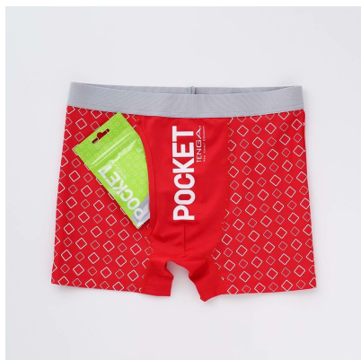
POCKET TENGAを収納可能なポケット付