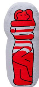
【unpis ダイカットクッション】