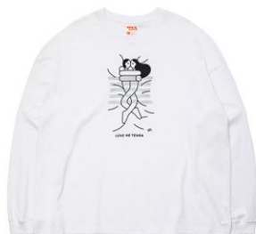
【unpis 長袖 Tシャツ】