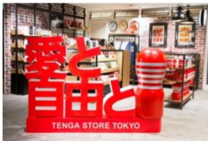
東京都千代田区有楽町 2-5-1 阪急メンズ東京 6F

TENGA が初めて世に出た日から 5000日目である、2019年3月15日にオープンした TENGA 唯一のフラグシップストアです。通常の TENGA 製品のほか、ストリートブランド「RIPNDIP」「ANTI SOCIAL SOCIALCLUB」とのコラボ製品の販売、アート集団「OVER ALLS」とのコラボアートの展示など様々な展開を行っています。