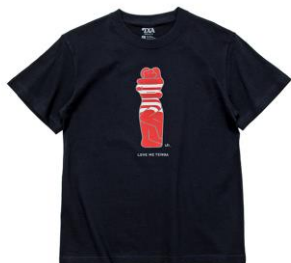
【unpis 半袖 Tシャツ】