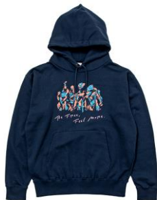
【OTANIJUN ブルオーバーパーカー】