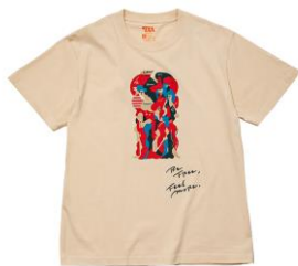
【OTANIJUN 半袖 T シャツ】