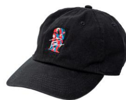
【OTANIJUN コットンツイルキャップ】