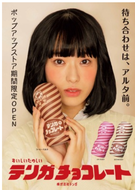
特別に制作したアルタ コラボレーション ポスター