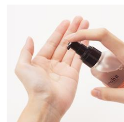
脱毛後、乾燥や肌の炎症などの トラブルはありましたか？

https://iroha-intimate-care.com/item/vio-lotion/