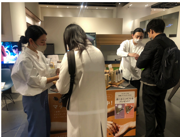
▲お客様がマッサージを体験されている様子