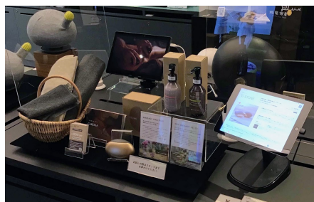
▲蔦屋家電+での出展の様子

b8ta tokyo-Yurakuchohaka 11/1~3/31 〒100-0006 東京都千代田区有楽町1-7-1 有楽町電気ビル1階 営業時間：11:00 ~ 19:30 定休日：不定休