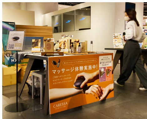
▲イベントブースの様子