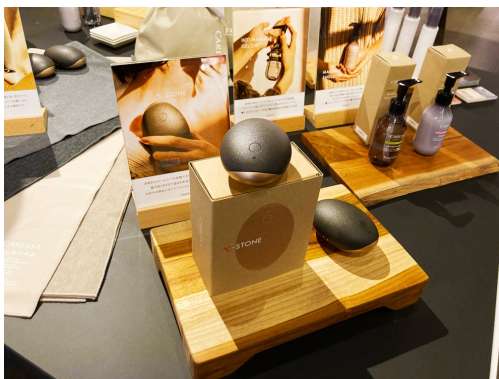
▲イベント時のブース展示。手にとってくださる方も多数いらっしゃいました。