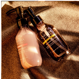
[OIL & EMULSION]